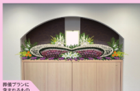
葬儀プランに含まれるもの