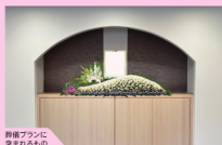
葬儀プランに含まれるもの