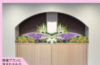
葬儀プランに含まれるもの