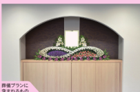
葬儀プランに含まれるもの